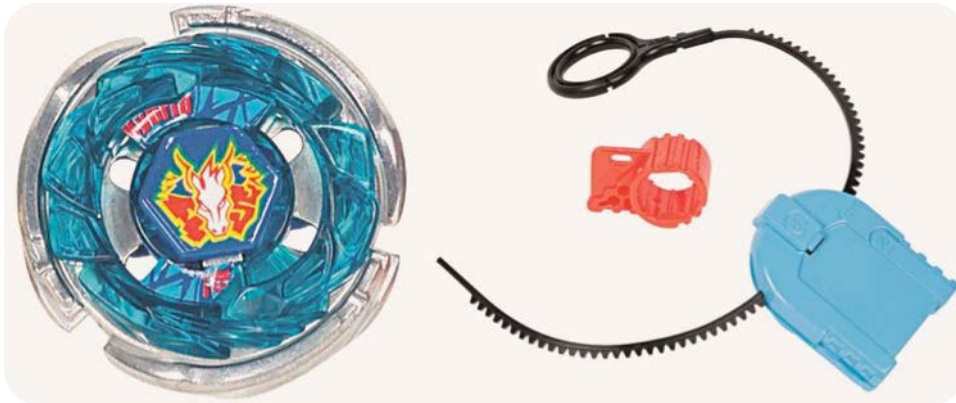
Une toupie Beyblade et son lanceur

- Les toupies Beyblade : ce sont des toupies en plastique issues d'un animé japonais du même nom. Elles ont la particularité d'avoir un lanceur, et de pouvoir être personnalisées de nombreuses façons pour modifier son mouvement, sa vitesse de rotation etc. Ces toupies ont fortement relancé l'intérêt des enfants vers ce jouet et on en retrouve souvent dans les cours de récréation, où le principe de jeu est d'arrêter la rotation de la toupie adverse avec sa propre toupie en les entrechoquant. Il existe ainsi des techniques de lancement de ces toupies, et des championnats ont même eu lieu lors du pic de popularité de ces jouets.