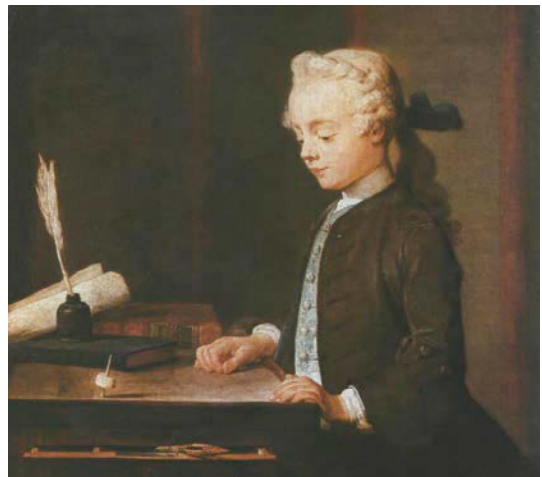
"L'enfant au toton" de Chardin vers 1735

- Le toton : jeu de hasard populaire qui se joue avec un cube (de bois ou encore d'ivoire) traversé par un axe et sert de toupie. On lance cette toupie sur un tableau composé de nombres en espérant qu'elle s'arrête sur celui que l'on a choisi. Le jeu tire son nom du latin totum (« tout ») qui désignait dans l'Antiquité romaine des jeux de hasard s'apparentant aux dés. Ce jeu est célèbre grâce à une peinture de Jean-Baptiste Chardin datant de 1735, on y voit un jeune garçon absorbé par son jeu de toton.