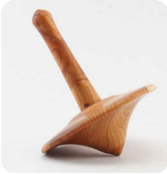
Toupie en bois