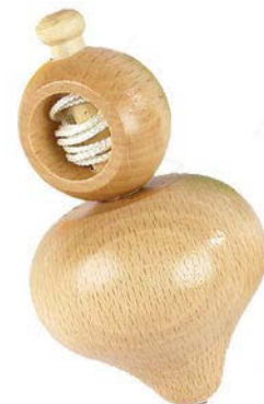
Toupie à ficelle en bois

- Les toupies à ficelles : souvent en bois et typiques des XIX ème et XX ème siècle avant l'essor des toupies en plastique, elles ont des formes diverses souvent sphériques.