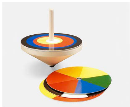
Toupie du Bauhaus avec disques colorés interchangeableables. Créée par Ludwig Hirschfeld-Mack, elle montre comment la rotation d'un objet peut modifier les couleurs.